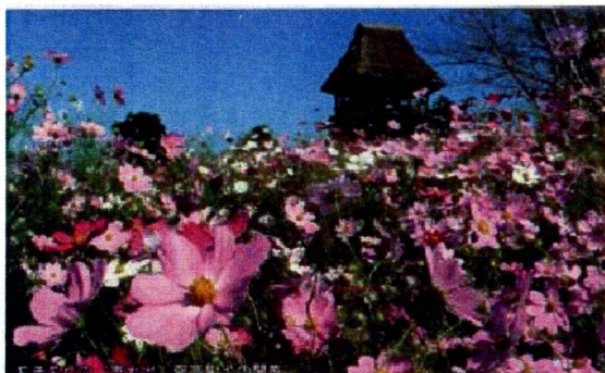
コスモスをだめにしないでね 台風さん!!