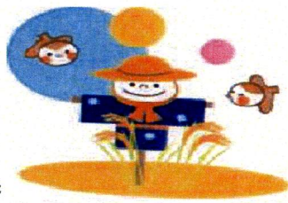
山田の中のカカシ

皆様, 健康増進のためにスポーツで心の腰を伸ばし, 美しさに見とれて芸術談義を交わすなど, 自己管理に努めましょう。その時には必ず, その シャキシャキの新米を側らに「青春の元」を携え, 張りのある生活が展開されますよう社員一同心から祈念申し上げます。