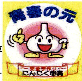
マスコットキャラクター

米国は33位、お隣中国は55位にランクされました。皆さん、健康第一。心も体も健康で、清々しい新年を迎えられますようご祈念申し上げます。( 文責 顧問 M. T )