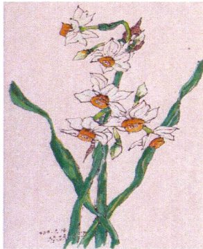
今月の花「スイセン」のスケッチ

今年の最後はやはり「大晦日」でしょうか。いやその前に、子供たちが待っているクリスマスがあります。