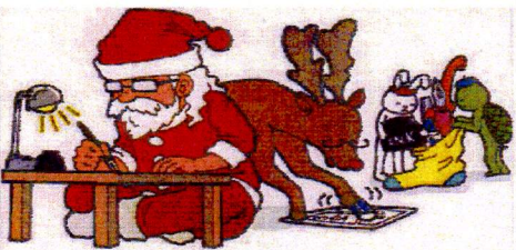
あわてん坊のサンタクロースか？もうクリスマス

「青春の元」ご愛用の皆様、来年もご愛顧いただき、素晴らしい新年を迎えられますよう社長はじめ、従業員一同ご祈念申し上げまして、今年の終わりの言葉と致します。